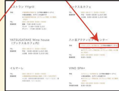
お問い合わせページ

アクティビティプログラム紹介ページ、 その他ページに設けられた、 「予約する」リンクを押します。